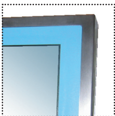
Châssis en inox 316L Dalle tactile avec protection